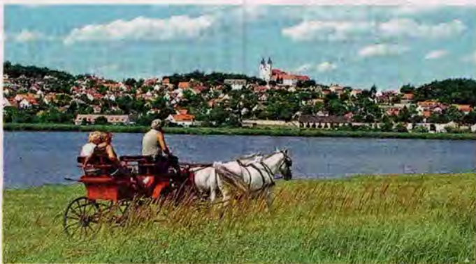
Für Besucher des Plattensees ist der Besuch der Halbinsel Tihany mit ihrer wunderschönen Pisky-Promenade ein absolutes Muss.

► Plattensee: Der Balaton (deutsch Plattensee) liegt in Westungarn, ist der größte Binnensee und neben dem Neusiedler See im Burgenland auch der bedeutendste Steppensee Mitteleuropas. Insgesamt ist er 79 Kilometer lang und im Schnitt 7,8 Kilometer breit. Die Fläche beträgt 594 Quadratkilometer, damit ist er 58 Quadratkilometer größer als der Bodensee.