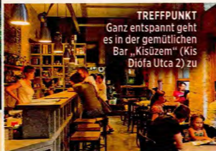
TREFFPUNKT Ganz entspannt geht es in der gemütlichen Bar „Kisüzem“ (Kis Diófa Utca 2) zu