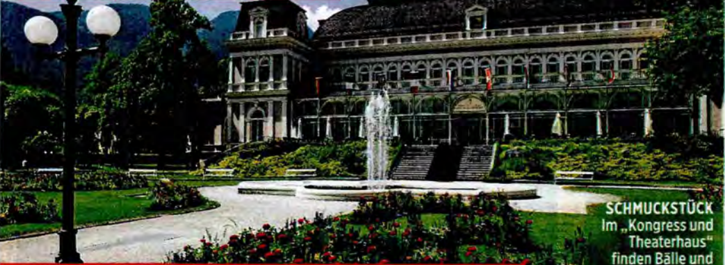
SCHMUCKSTÜCK Im „Kongress und Theaterhaus“ finden Bälle und Operettenaufführungen statt