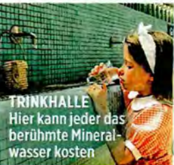
TRINKHALLE Hier kann jeder das berühmte Mineralwasser kosten

PREISBEISPIEL: 1 Ü im Hotel „Trianon“ ab 54 Euro, Frühstück 7,70 Euro, www.hotel-trianon03.com