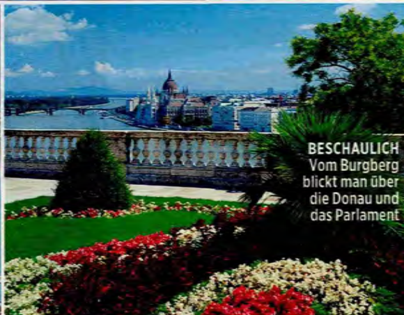
BESCHAULICH Vom Burgberg blickt man über die Donau und das Parlament

ABEND-IDYLLE ... im Stadtwäldchen – einem beliebten Naherholungsgebiet mit Terrassencafés und Bootsverleih