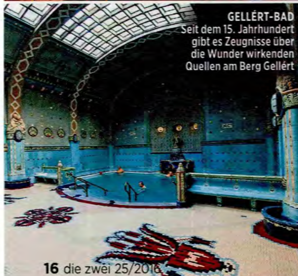
GELLÉRT-BAD Seit dem 15. Jahrhundert gibt es Zeugnisse über die Wunder wirkenden Quellen am Berg Gellért