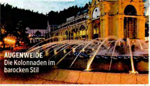
AUGENWEIDE Die Kolonnaden im barocken Stil