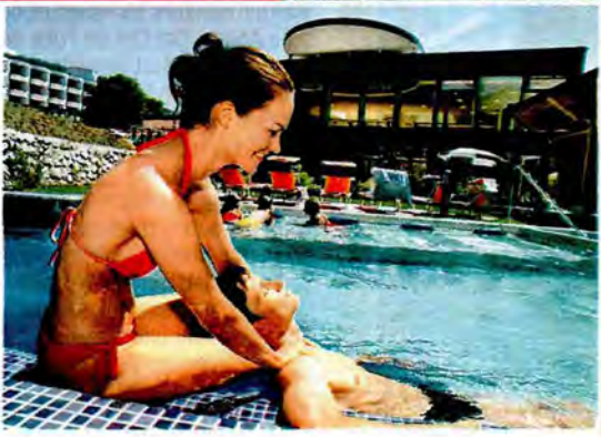
DAS EUROTHERMENRESORT bietet ein abwechslungsreiches Badevergnügen und eine einzigartige Saunawelt

PREISBEISPIEL: Übernachtung mit Frühstück im Hotel „Goldenes Schiff“ ab 85 Euro p. P., www.goldenes-schiff.at