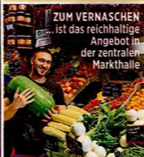
ZUM VERNASCHEN ... ist das reichhaltige Angebot in der zentralen Markthalle

PREISBEISPIEL: 3 Ü/F im 4-Sterne-Hotel „Opera“ inkl. Flug (z. B. am 1.7. ab Berlin) ab 312 Euro p. P., www.thomascook.de