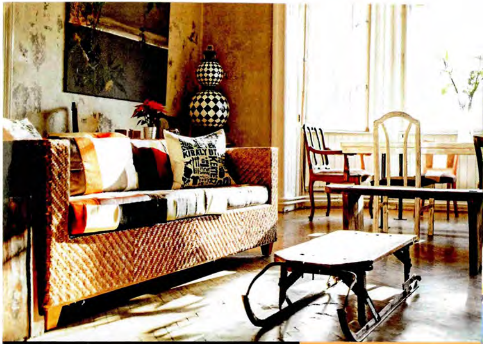
028 Schön schäbig: Das gefällt jugendlichen Stadtbesuchern besser als unterkühlt gestylte Hotelzimmer