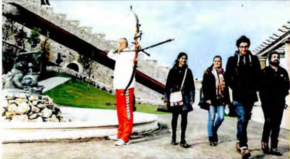
054 Volltreffer: Ungarns Spitzensportler in der Stadt, die sich um die Olympischen Spiele bewirbt