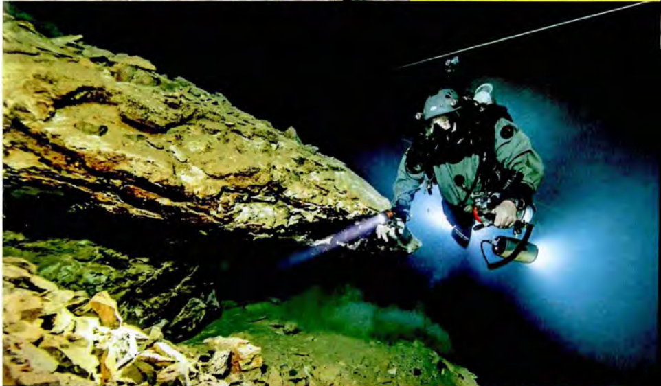
098 Schwebestand: Attila Hosszú führt Taucher durch die flüssige Budapester Unterwelt