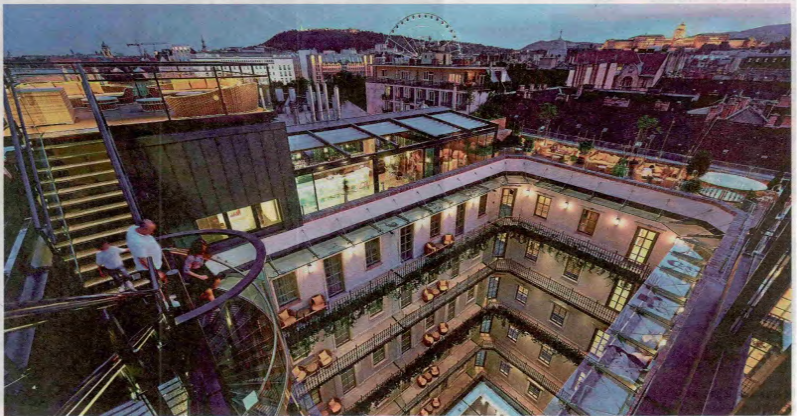
Die Szene erwacht über den Dächern der Stadt: Rooftop-Locations wie die High Note Skybar auf dem Hotel „Aria“.