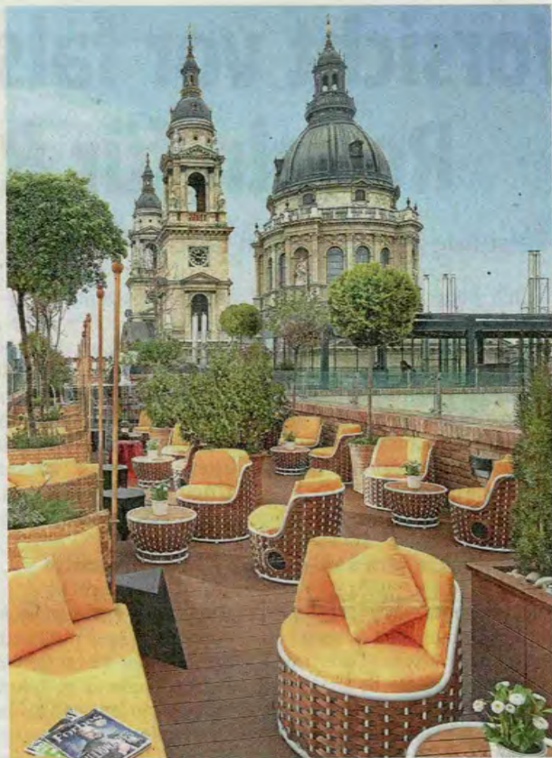
Blick von der Bar auf die St.-Stephans-Basilika.