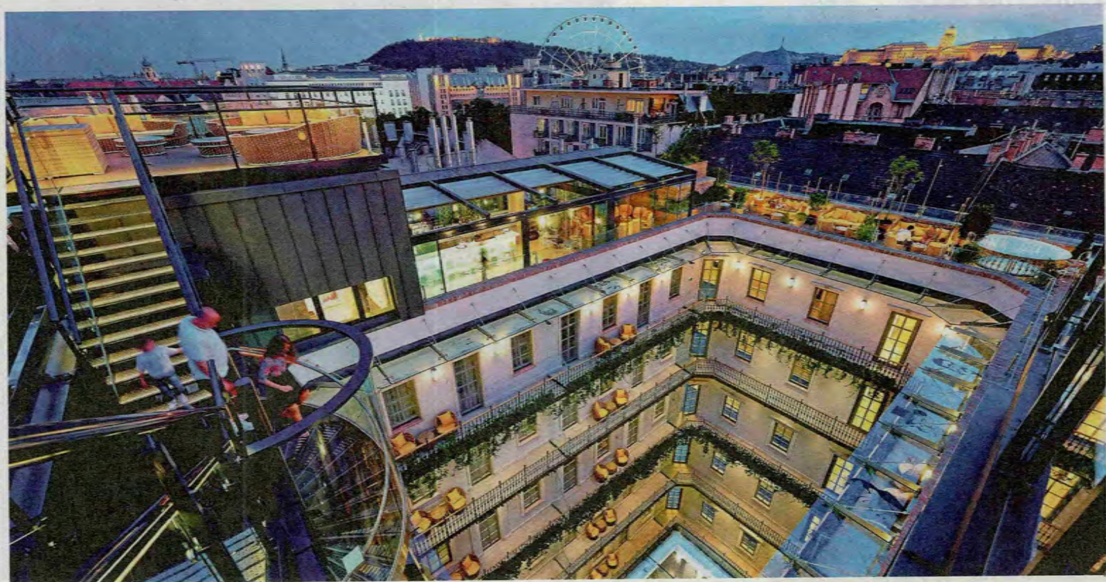
Die Szene erwacht über den Dächern der Stadt: Rooftop-Locations wie die High Note Skybar auf dem Hotel „Aria“.