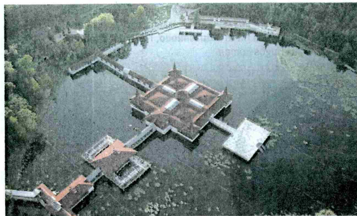
Der Thermalsee bei Bad Hévíz.

Die Gäste werden von erfahrenen, deutschsprachigen Ärzten und geschultem Fachpersonal